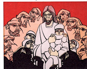
Kristustolkning av den japanska konstnären Masaru Horia.