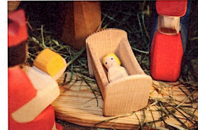
Jesusbarnet i krubban.