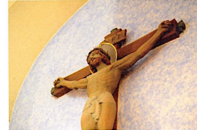
Jesus på korset, här i Överluleå kyrka.