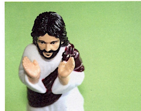
Jesus porträtteras i minst sagt många olika former... Här som så kallad "dashboard figurin".