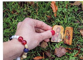
Här som ikon.