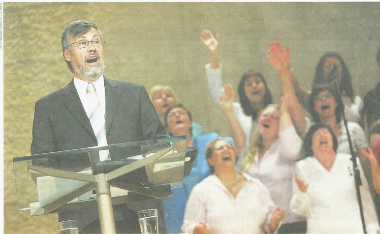
Gudstjänst på Livets ord med Ulf Ekman vid podiet.

– konservativa inom Svenska kyrkan, ortodoxa och katoliker. Jesuismen i stiftelsen och tidningen Världen idag har gett nya kontakter, Ulf Ekman har estradragat med kyrkoledere och politiker, till Marcus Birro som supporter och Peter Halldör och Björn Pärsteds som skribenter i Livets ord utskrifts keryx. Livets ord ordnar retreatar, och har formulerat en högkyrklig, nästan katolsk, nattvardssida. UTVECKLINGEN HANGLAR också om småt som ett allt större socialt arbete bland flyktingar och hemlösa i Uppsala. I takt med normaliserade relationer har kritiken tystnat – inte i församlingens historiskskrivning spelar den roll. Den första jubileumsboken Tacksam skriver om "motsänder" – ja, om en "massiv väg av följelse, från både andra kyrkor och massmedia". På ett enda ställe nämns egna missag – "att Gud var god