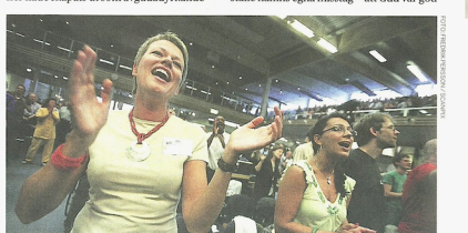
Lovsång med handklapp och lyfta händer är ett signum för Livets ord.