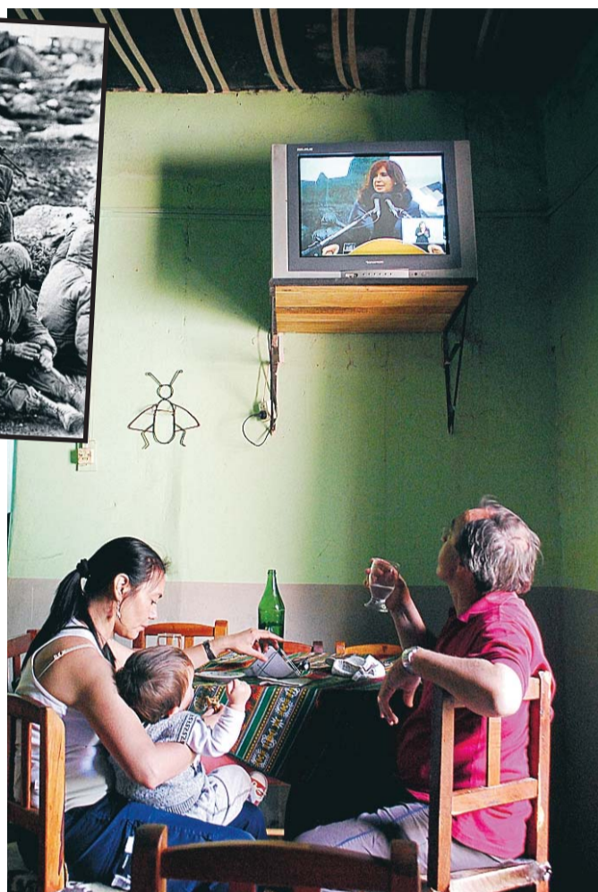
President Cristina Fernández de Kirchner talade direkt i TV till sina landsmän på 30-årsdagen av Argentinas försök att återta Falklandsöarna.