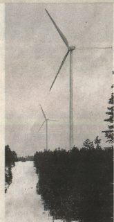
Bort från fossil energi – vindkraft är ett alternativ.