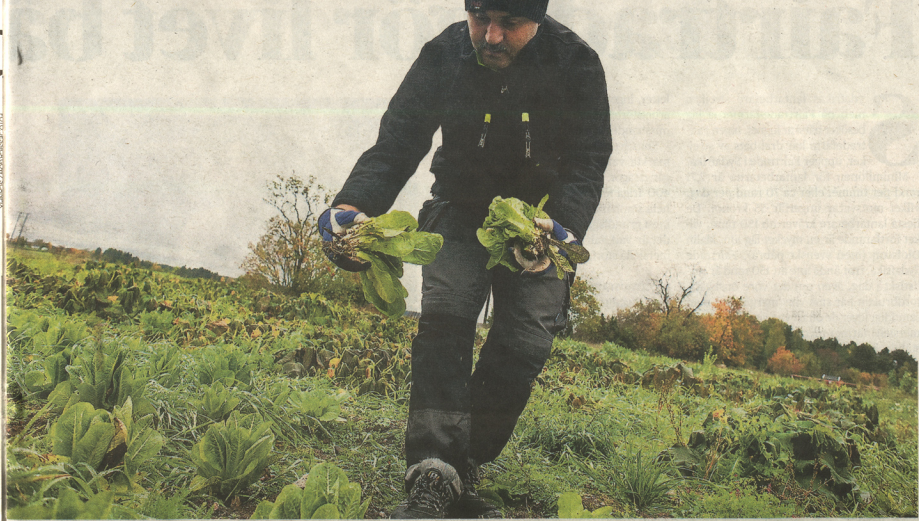
Processen går från relationer, kreativitet till handling, där odling i detta fall står för handling. Att stödjia eller själv odla har massor av fördelar varav minskad klimatpåverkan bara är en.