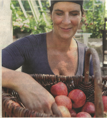
Praktiskt och konkret: Ta tillvara på dina äpplen – musta! Här Äppelfabriken på Fråningsö.